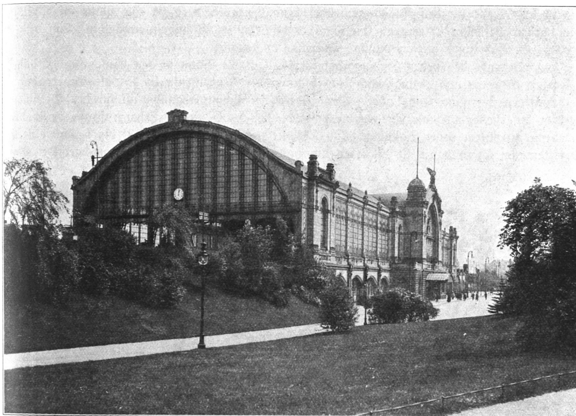
Abb. 792. Dammtorbahnhof.

der Lombardsbrücke steigt die Bahn in 1:110 bis nach dem neuen Dammtorbahnhöfe (Abb. 792 und 793), der westlich des alten Bahnhofs am Loignyplatze erbaut ist. Dieser Bahnhof ist als Durchgangsbahnhof so angelegt, daß unter den Gleisen die Empfangs- und Betriebsräume (Abb. 792) angeordnet sind; die hochliegenden, mit einer Halle überdachten Gleise und Bahnsteige sind durch je zwei Treppen mit den Empfangsräumen verbunden. Durch die Verfügung, daß von jedem der beiden Bahnsteige nur eine Treppe für den Eingangs- und