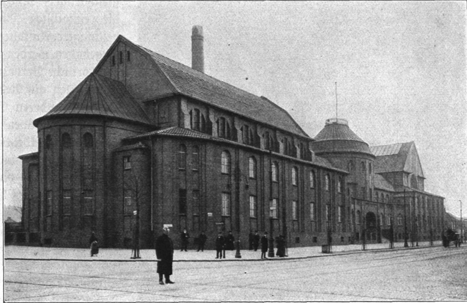
Abb. 746. Badeanstalt Hammerbrook.

Die Schwimmbecken haben folgende Abmessungen: