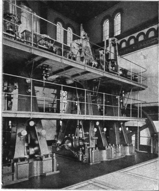
Abb. 705 und 706. Verbundmaschinen III und VIII, Schnitt und Ansicht.