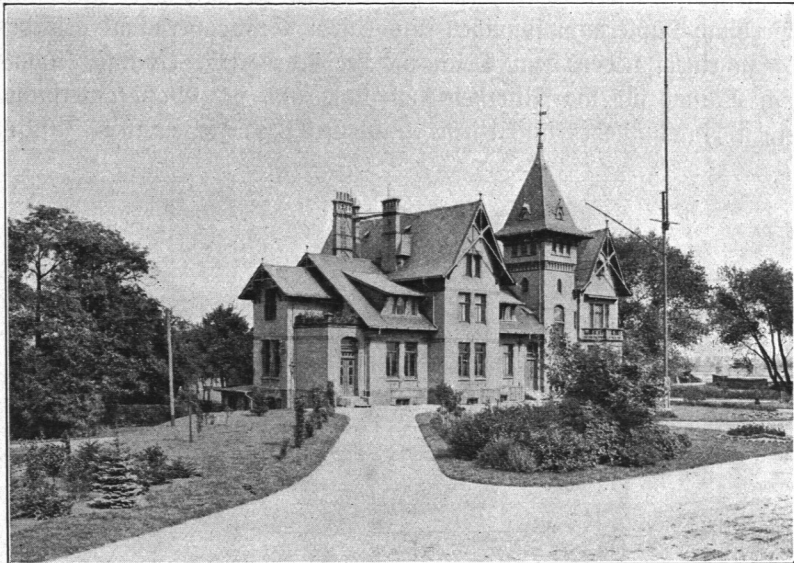
Abb. 697. Betriebsgebäude mit Dienstwohnungen.

Die Wiedereinstellung eines Filters in den Betrieb erfolgt immer in der Weise, daß es zunächst aus dem neben ihm liegenden Reinwasserkanal von unten bis etwa 20 cm über Sandoberfläche in ganz gleichförmiger Verteilung über diese und dann von oben mit unfiltriertem Wasser weitergespült wird; bei diesem Verfahren bleibt die Oberfläche völlig eben. Das aus einem gereinigten Filter in den ersten 24 Betriebsstunden abfließende Wasser, das sogenannte Spülfiltrat, gelangt nicht zu nutzbarer Verwendung, sondern wird als Abwasser angesehen, wenn auch sein Reimgehalt in den weitaus meisten Fällen so niedrig ist, daß es ganz unbedenklich für Versorgungszwecke verwendet werden könnte; in diesem Verfahren liegt eine Vorsicht, die vielleicht nicht beobachtet zu werden brauchte.