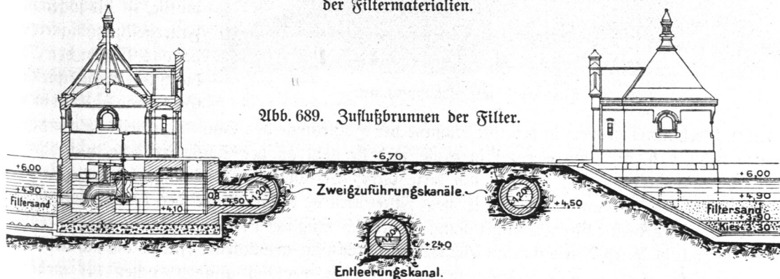
Abb. 689. Zuflußbrunnen der Filter.