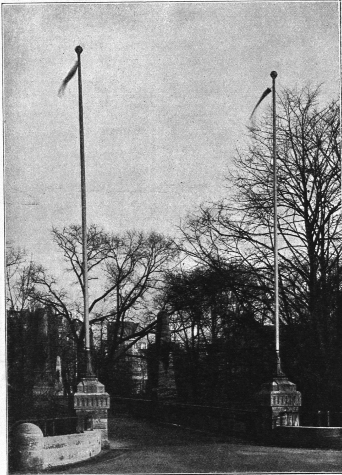
Abb. 570. Flaggenstangen an der Fußgängerbrücke in den Wallanlagen.

Die Abb. 574 gibt ein Bild von einem eisernen Beleuchtungskörper für elektrische Glühbirnen in den Wallanlagen wieder; die Höhe beträgt etwa 3,50 m.