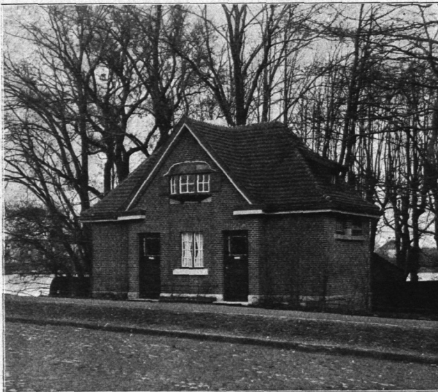
Abb. 531. Bedürfnisanstalt bei der Krugkoppelbrücke, Ansicht.