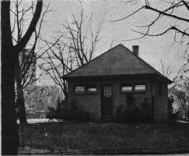
Abb. 529. Bedürfnisanstalt Mundsburger Damm, Ansicht.

Bedürfnisanstalten. Die in den Abb. 529 und 530 wiedergegebene Bedürfnisanstalt liegt in einer kleinen Grünanlage. Die großen Baumassen, die den Platz umschließen, erforderten eine einfache und gedrungene Architektur. Bei der Bestimmung der Baustoffe war eine Zusammenstellung von kräftigen Farbengegensätzen erwünscht. Der Sockel besteht aus Basaltlava.