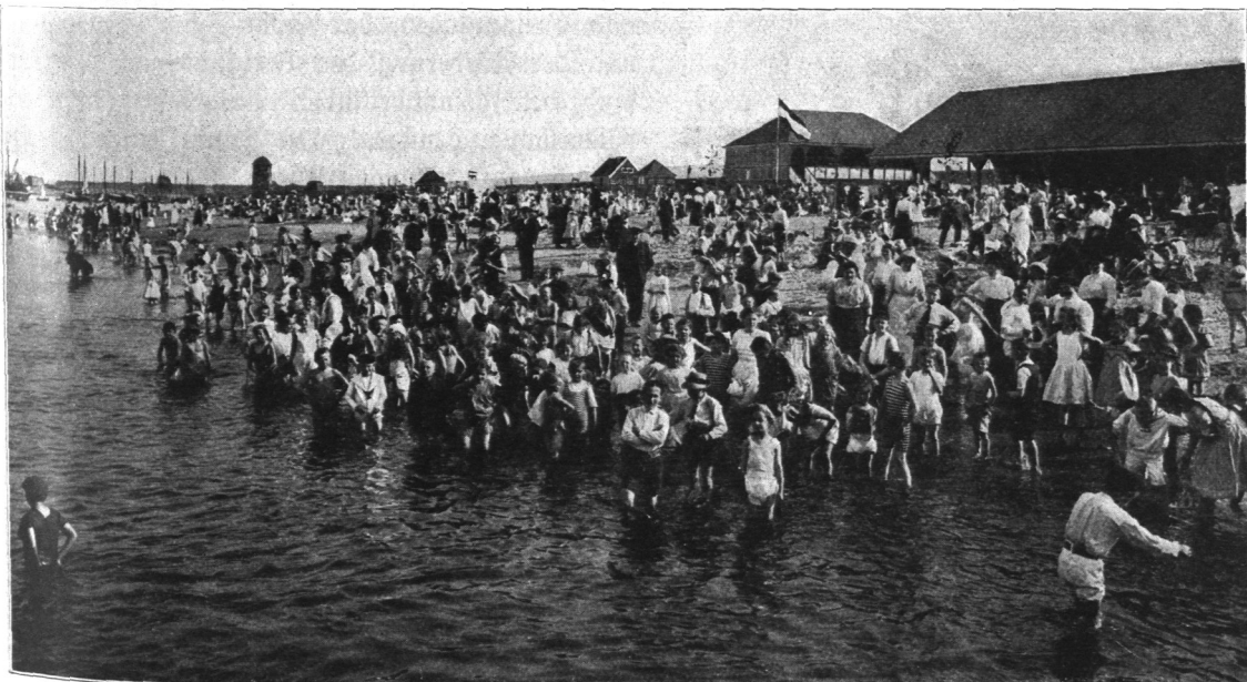
Abb. 485. Spielplatz für Kinder am Köhlbrand, Verkehrsanficht.

sonen angemietet und gegen wesentlich erhöhte Preise an die Untermieter verpachtet, ohne daß irgendwelche Aufwendungen für Wege usw. gemacht wurden. Seit 1907 hat die gemeinnützige Patriotische Gesellschaft mit Unterstützung der Finanzdeputation und des Ingenieurwesens die Anmietung von geeigneten unbebauten Staatsflächen gegen einen Einheitspreis von durchschnittlich 1,5 Pf./qm übernommen. Sie teilt das Land passend ein, versieht es mit genügend breiten Aufteilungswegen, die etwa 10% der Gesamtflächen ausmachen, sorgt für angemessene