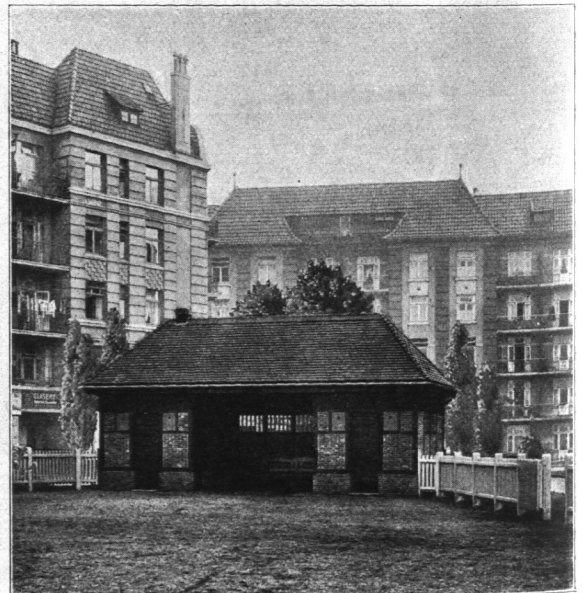
Abb. 471. Jugendspielfeld Dulsberg, Schutzhalle.