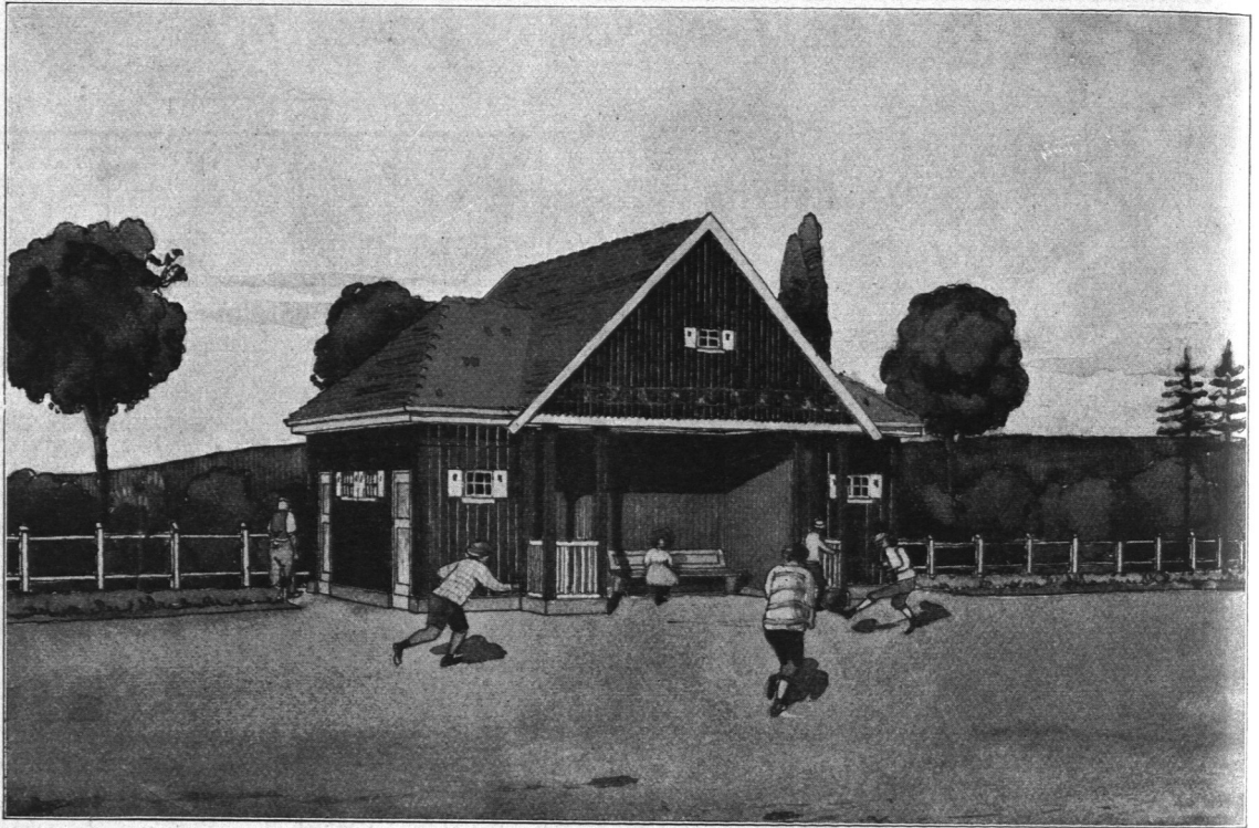
Abb. 468. Jugendspielfeld Hasselbrookstraße, Schutzhalle, Ansicht.