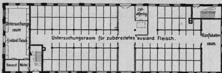
Abb. 394. Viehhof Sternschanze, Dienstgebäude für die Auslandsfleischschau, Grundriß, Erdgeschoß.