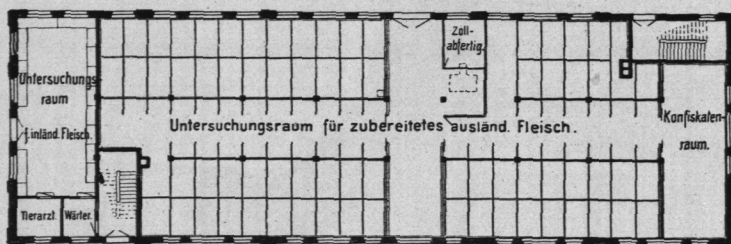
Abb. 394. Viehhof Sternschanze, Dienstgebäude für die Auslandsfleischschau, Grundriß, Erdgeschoß.