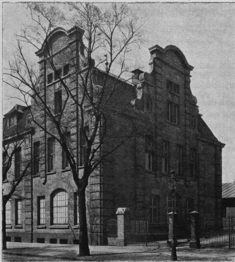
Abb. 393. Viehhof Sternschanze, Dienstgebäude für die Auslandsfleischschau, Ansicht.