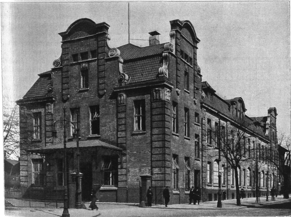
Abb. 392. Viehhof Sternschanze, Dienstgebäude für die Auslandsfleischschau, Ansicht. Entwurf: Ingenieurwesen der Baudeputation.