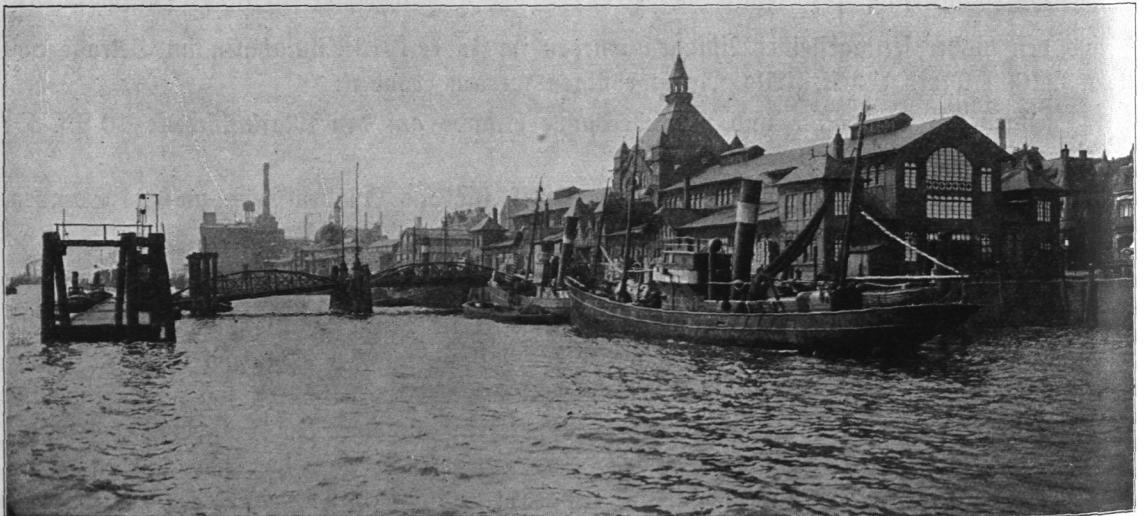
Abb. 387. St.-Pauli-Fischmarkt, Ansicht der Gesamtanlage mit Halle.

sowohl den Zwecken der Verauktionierung und des Versandgeschäfts, als auch des Kleinhandels dient, durch beiderseitige Anbauten auf 3000 qm Bodenfläche vergrößert werden. (Abb. 386.) Gegenüber der Fischhalle hat eine Anzahl Fischversandgeschäfte auf Staatsgrund, der den