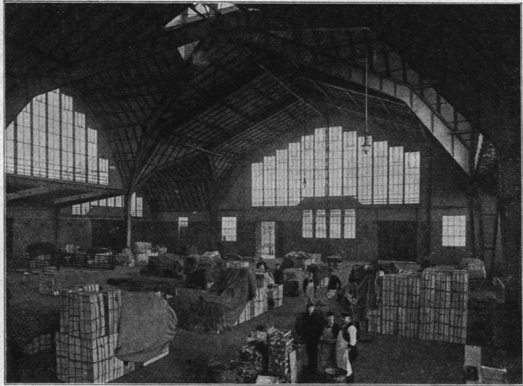
Abb. 371. Marktanlagen am Deichtor, Inneres der südlichen Markthalle.

Für eine ausgiebige Tagesbeleuchtung der Innenräume mit unmittelbarem Seitenlicht ist u. a. durch Anordnung hoher Giebel Fenster gesorgt. Die künstliche Beleuchtung erfolgt durch elektrisches Bogen- und Glühlampenlicht.