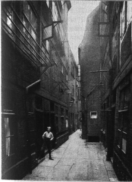
Abb. 354. Hof Schaarmarkt Nr. 28/29.