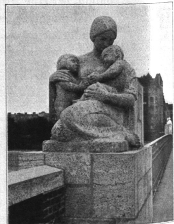
Abb. 319. Brücke Auschlägerweg, Gruppe „Die Ruhe“.

Von erheblicher wirtschaftlicher und technischer Bedeutung war die Ausbildung und Ausführung der Drehbrücke einschließlich des Drehpfeilers. (Abb. 323.) Der Auflagerpunkt des Drehzapfens wurde möglichst tief, auf +1,45 m H. N. d. i. 1,5 m unter der Sohle des Oberhafens, rund 6,5 m unter Mittelhochwasser, angeordnet, um dem großen Rippbestreben der Drehbrücke mit möglichst großem Hebelarm entgegenwirken zu können. Der innere Hohlraum des 13,4 m starken