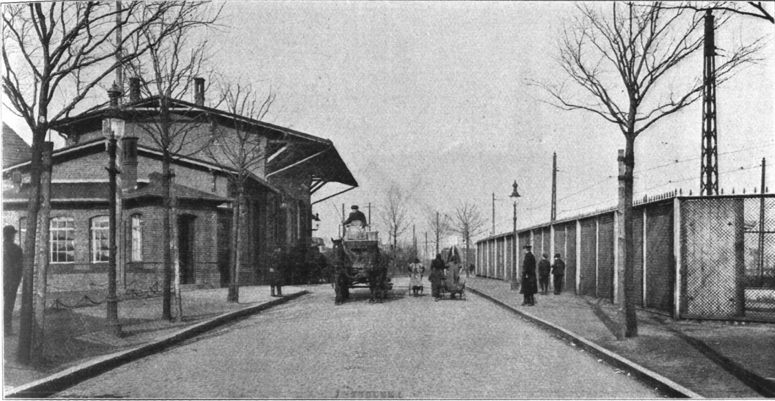
Abb. 231. Nebenzollamt I Ernst-August-Schleuse.

Futtergerste beim Eingang angemeldete Gerste für die andern Zwecke ungeeignet gemacht. Früher geschah dies dadurch, daß sie denaturiert, und zwar entkeimt wurde; heute färbt man sie mit Eosin. Diese Abfertigung wird von der Zollverwaltung an bestimmten Eingängen in das Zollinland vorgenommen.