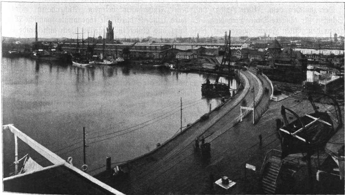
Abb. 182 a. Blick vom Dampfer „Pretoria“ nach dem Lenzkai.