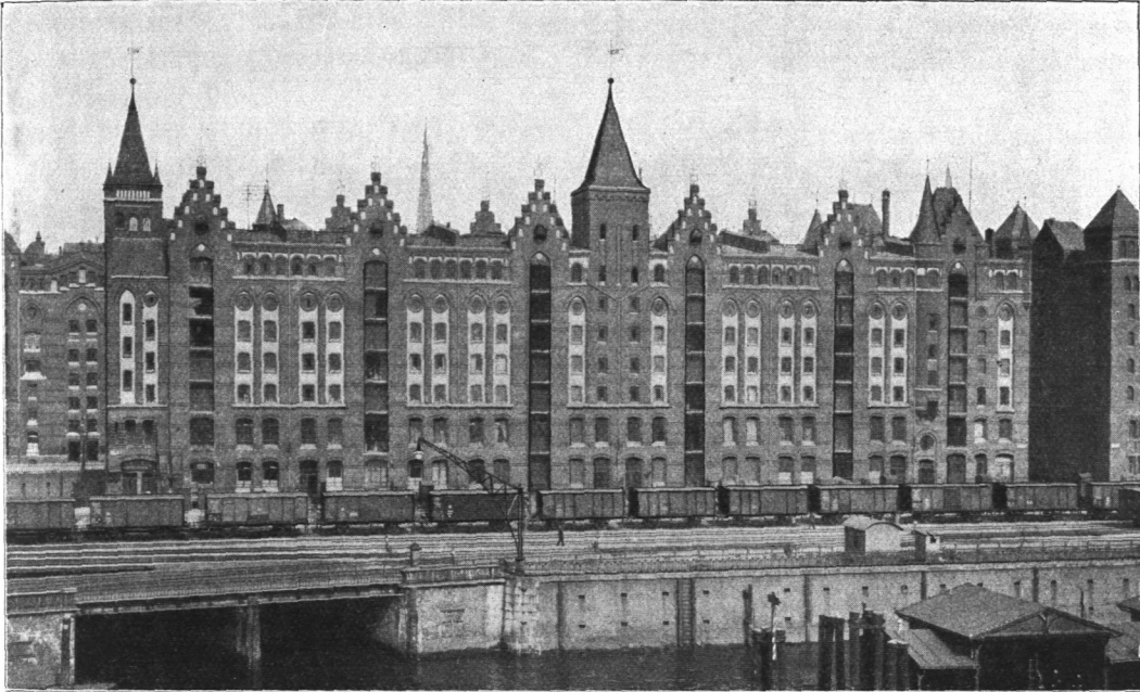
Abb. 140. Speicherblock V.

und 1905/06 der ganze Speicherblock V gebaut. (Abb. 140.) Da die Beschaffung von gutem Eichenholz für die zahlreichen starken Speicherstützen immer schwieriger wurde, war die Lagerhaus-Gesellschaft genötigt, eine andere, gleich feuer sichere Bauart für die weiteren Speicher zu wählen. Auf Grund der schon erwähnten Versuche über die Feuer sicherheit von Speicherstützen wurde für Block W und V eine von der bisherigen vollständig abweichende Bauart gewählt, nämlich gußeiserne Säulen, die im Keller sehr stark sind und in den oberen Böden allmählich an Umfang und Wandstärke abnehmen. (Abb. 141 und 142.) Am Kopfe dieser Säulen ist ein durch Rippen abgestützter runder Flansch angegossen, der zur Auflagerung der schmiedeeisernen Unterzüge dient. Vom Keller bis auf den Dachboden sind überall Boutendecken eingespannt, die die auf den Säulen aufliegenden Unterzüge völlig umhüllen und vor Rostbildung schützen. Die Säulen haben eine Ummantelung von Korksteinplatten erhalten, der zwischen Säule und Kork verbleibende Raum dagegen wurde mit Zementmörtel ausgegossen, der Korkmantel außen noch mit Zementputz und dieser wieder mit einem Blechmantel umgeben. Über den Boutendecken ist ein gespundeter Ahornfußboden auf Lagerhölzern verlegt.