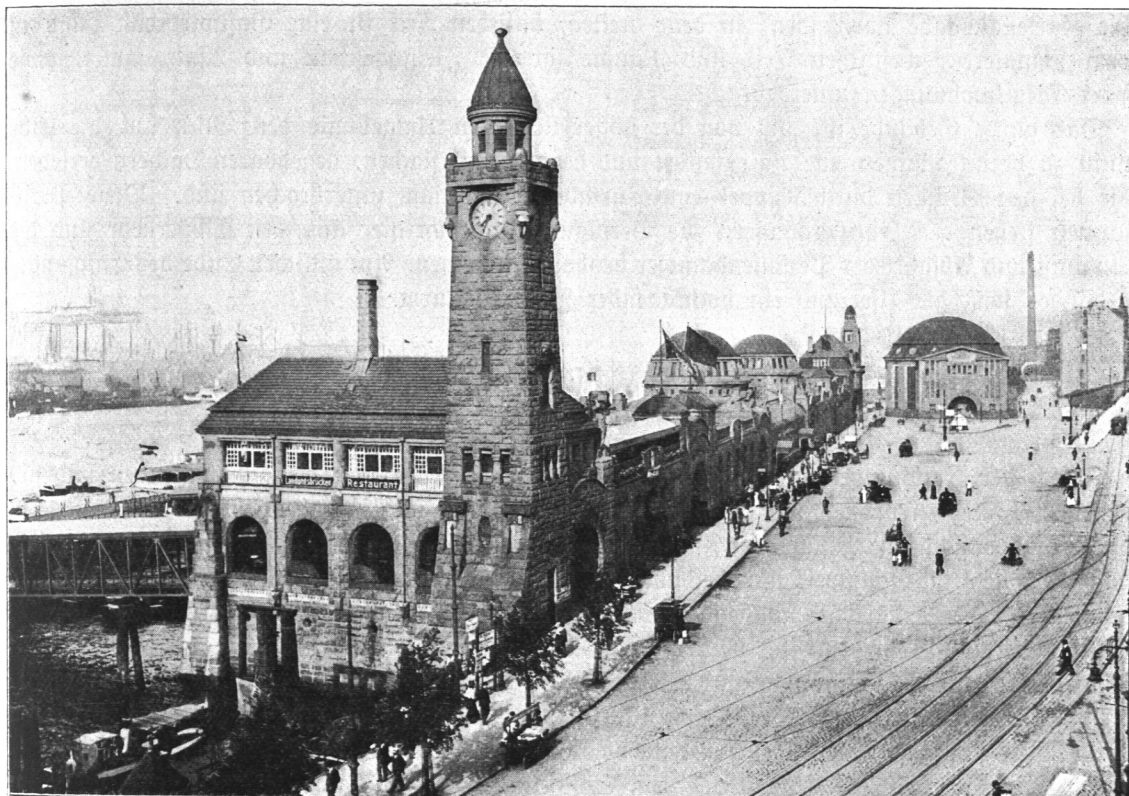
Abb. 118. St.-Pauli-Landungsbrücken, Empfangsgebäude.

führt wird. Hierdurch wird verhindert, daß beim Auftreten von Kräften in der Längsrichtung der Bühne, wie beim Tidewechsel, die Rollenlager unzulässig beansprucht werden oder von den Rollbahnen gleiten können. Bei etwaigen Ausbesserungen können die Brücken ebenso wie bei den Fähranlagen an den beiderseits angeordneten Pfahlgruppen aufgehängt werden. Diese Pfahlgruppen dienen gleichzeitig dazu, die Landungsbühne festzuhalten und die auf die Bühne wirkenden Kräfte und Stöße aufzunehmen; sie sind deshalb besonders kräftig ausgebildet. Hinter den Pfahlgruppen liegen Schwimmbäume, die mit dem Eisenbau der Landungsbühne durch kräftige Ketten verbunden sind und so das Abtreiben der Bühne verhindern.