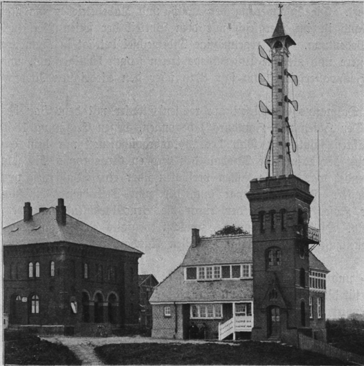
Abb. 68. Wasserstandsanzeiger bei Brunsbüttel.

Außer den Seezeichen, die bei Tage wie bei Nacht die Fahrwassergrenzen bezeichnen, sind, um den Schiffen die jeweilige Höhe des Wasserstandes anzuzeigen, an verschiedenen Stellen besondere Bauwerke errichtet. Die in den Häfen vorhandenen Rollbandpegel werden bei Nacht erleuchtet und gestatten, die Höhe des Wasserspiegels über