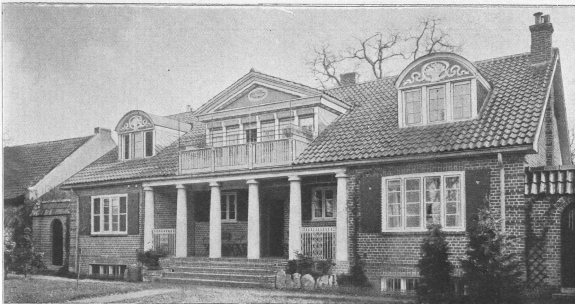
Abb. 1092 und 1093. Landhaus Kohlsaatz, Klein-Flottbek, erbaut 1909 durch die Architekten B. D. U. Raabe & Wöhlecke.