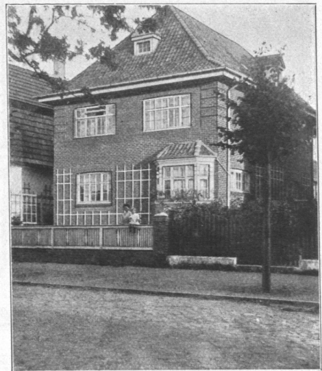
Abb. 1084. Landhaus Waldhausen, erbaut 1909 durch Architekt D. Wilkening. Baukosten 19536 Mark, für das Kubikmeter umbauten Raumes 18,70 Mark.