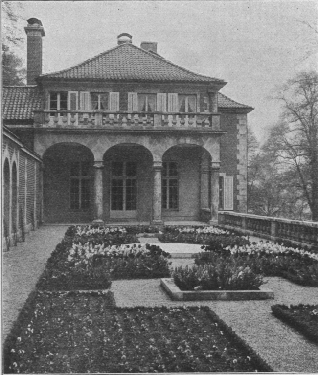
Ansicht nach dem Garten.