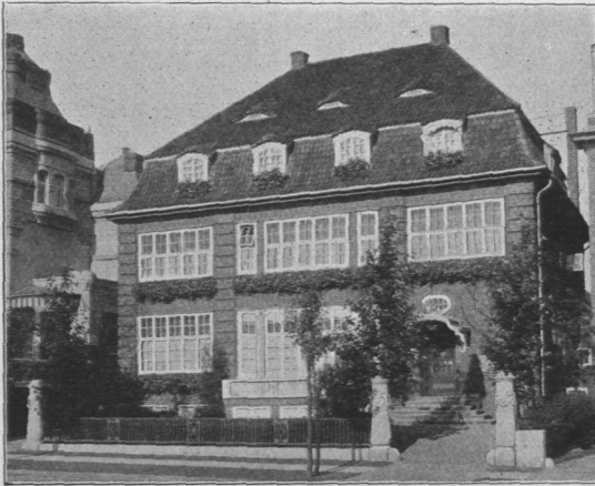
Abb. 1044 und 1045. Haus Heilbuth, Feldbrunnenstraße 70, erbaut 1909 durch die Architekten Hans und Oscar Gerson. Baukosten 117000 Mark.