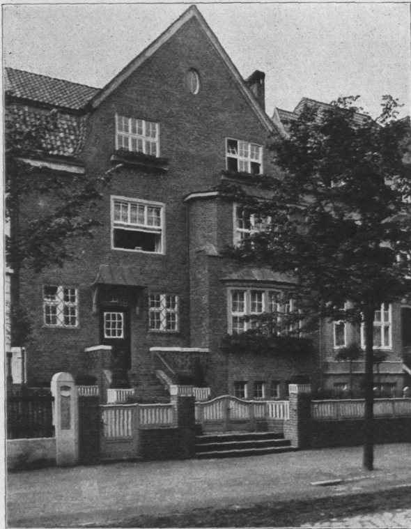
Abb. 1046 bis 1048. Haus Alfr. Löwengard, Sierichstraße 177, erbaut durch Architekt Alfr. Löwengard, B. D. U.