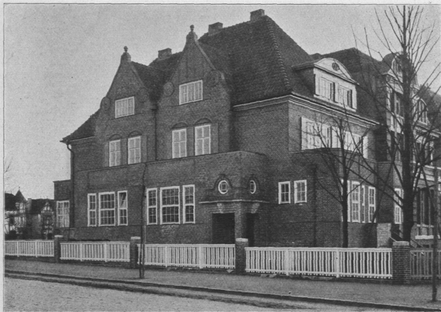
Abb. 1031. Haus Die Mustad, Heilwigstraße 124, erbaut 1913/14 durch Architekt G. Henry Grell, B. D. U. Baukosten 120000 Mark.