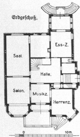
Abb. 1006 und 1007. Haus Zfermann, Bellevue, erbaut 1897 durch Architekt Hugo Groothoff, B. D. U. Baukosten 147000 Mark, für das Kubikmeter umbauten Raumes 33 Mark.