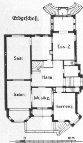
Abb. 1006 und 1007. Haus Zfermann, Bellevue, erbaut 1897 durch Architekt Hugo Groothoff, B. D. U. Baukosten 147000 Mark, für das Kubikmeter umbauten Raumes 33 Mark.