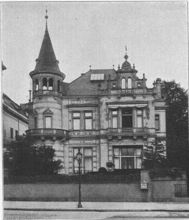
Abb. 998. Haus Sanders, Alsterufer 28, erbaut 1883 durch Architekt Martin Haller. Baukosten 175 000 Mark.