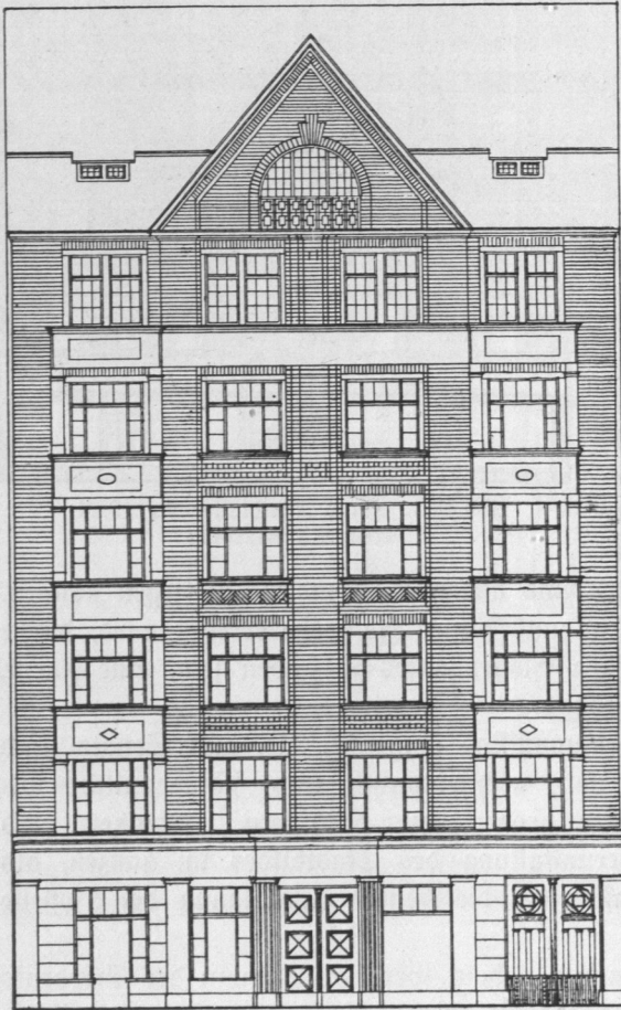
Abb. 986. Haus Billstraße Nr. 107. Architekt W. Holzappel.