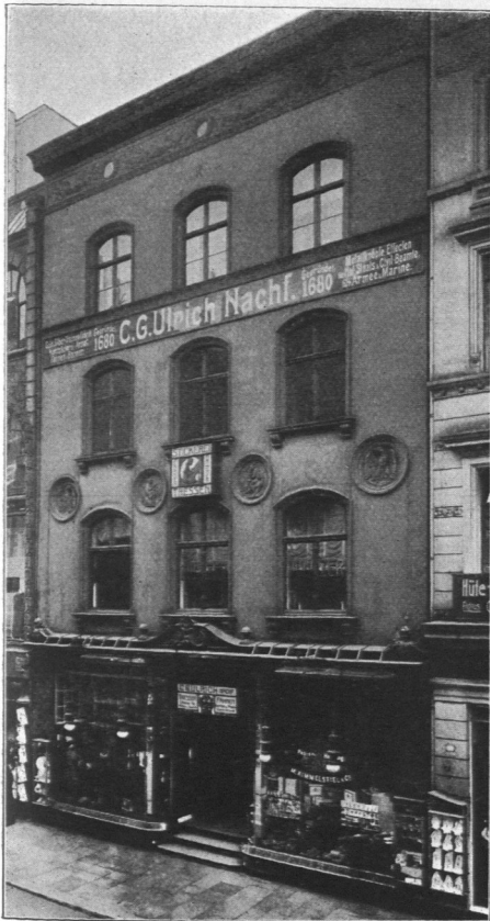
Abb. 954. Haus Neuerwall Nr. 39.