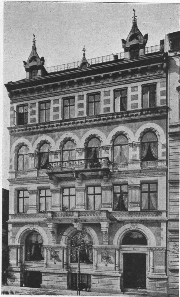
Abb. 955. Haus Steinhauerdamm Nr. 2. Architekt R. Bichweiler. 1879.

Das Jahr 1862 ist insofern als ein Abschnitt in der Baugeschichte Hamburgs zu bezeichnen, als mit dem Fallen der Torsperrre eine wachsende Bautätigkeit einsetzte und viele wohlhabende Bürger Hamburgs ihre bisherige Wohnung in der Stadt verließen, um sich vor den Toren anzusiedeln. Nun wurde manches Einzelhaus frei und der Platz für ein Etagenhaus ausgenutzt, manches alte Kaufmannshaus wurde zu mehreren Wohnungen umgebaut.