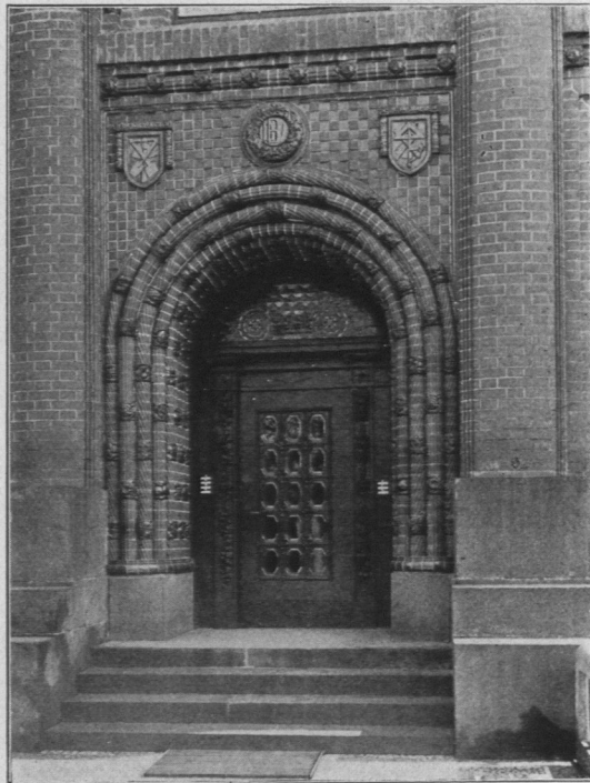
Abb. 932. Verwaltungsgebäude des Deutschen Bauarbeiter-Verbandes in Hamburg, Eingang.