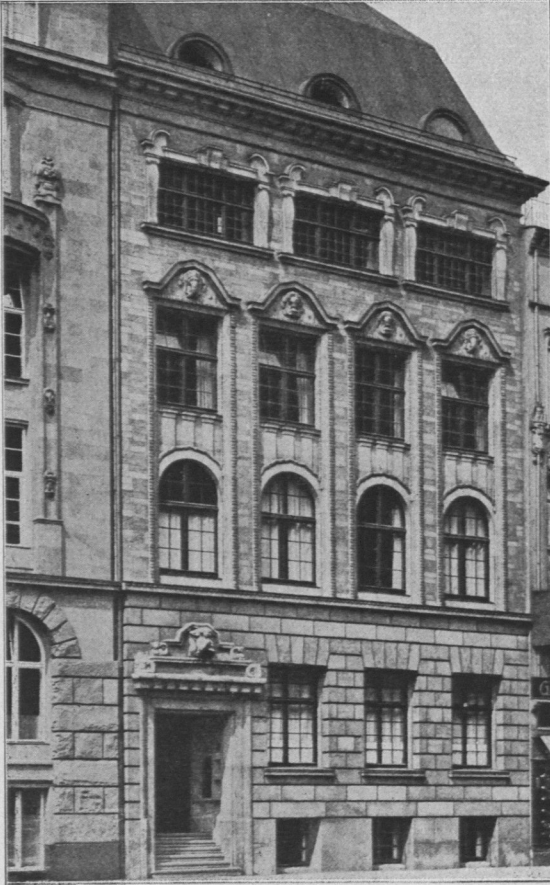
Abb. 926. Geschäftshaus Theodor Wille.