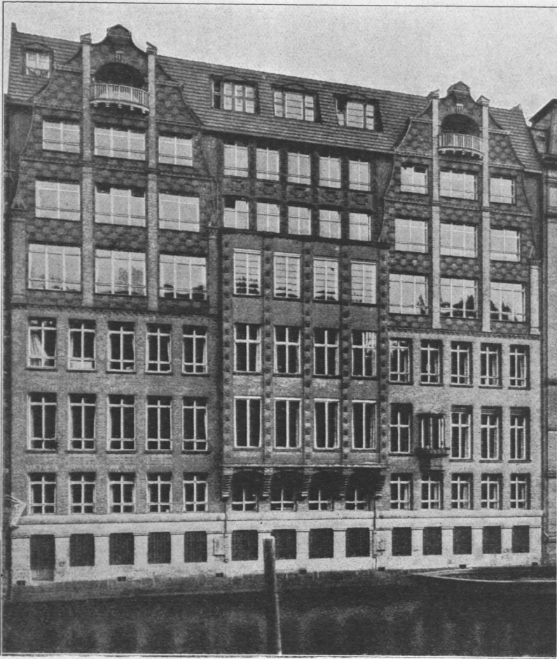
Abb. 924. Nord-deutsche Versicherungs-Gesellschaft, Fletanansicht.

Nord-deutsche Versicherungs-Gesellschaft, Alterwall 12, erbaut 1908/09 von den Architekten Emil Schaudt, B. D. A., und Emil Janda. Das Haus dient den Zwecken der Gesellschaft. Das Gebäude besitzt außer dem Untergeschoß noch einen Tiefkeller, der an der Straßenseite Kleiderschränke für etwa 300 Beamte, in der Mitte die Heizungs- und Maschinenanlage und an der Wasserseite die Steindruckerei der Gesellschaft enthält. Da der Wasserspiegel des Flets bedeutend tiefer liegt als die Straße, konnte die Druckerei gut belichtet werden. Die Fenster sind hier nach Art der Schiffsfenster mit Gummidichtung und Flügelschrauben versehen. Die Direktionsräume, der Sitzungssaal und das Treppenhaus sind reich ausgestattet. Die Straßenseite besteht aus einem Sockel aus poliertem Kalkstein und Oberbau aus Lautereckener Sandstein, die Fletseite aus roten schlesischen Handstrichsteinen und Eisenklinkern auf Granitvorsetzen. Die Baukosten betragen rund eine Million Mark, einschließlich der besonderen Innenausstattung.