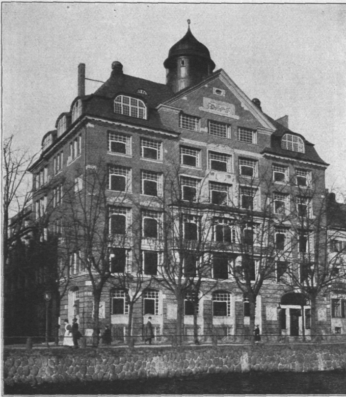
Abb. 919. Deutsch-Amerikanische Petroleum-Gesellschaft.