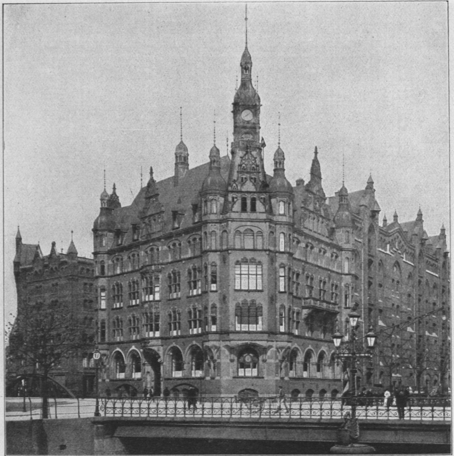
Abb. 913. Hamburger Freihafen-Lagerhaus-Gesellschaft.