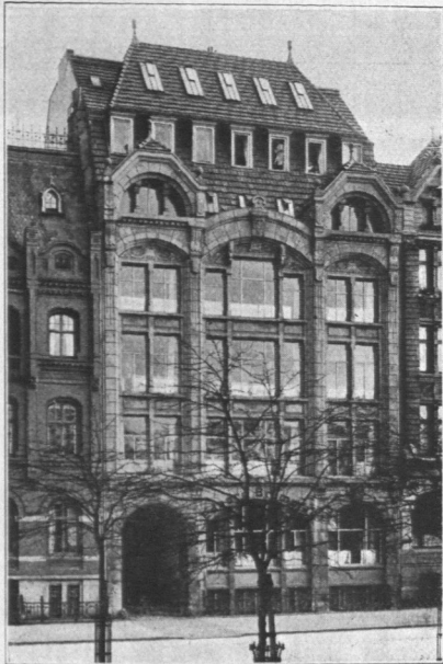
Abb. 911. Haus Brammer.