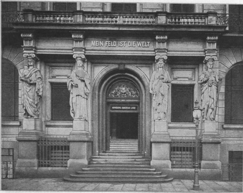
Abb. 910a. Hamburg-Amerika Linie, Haupteingang.