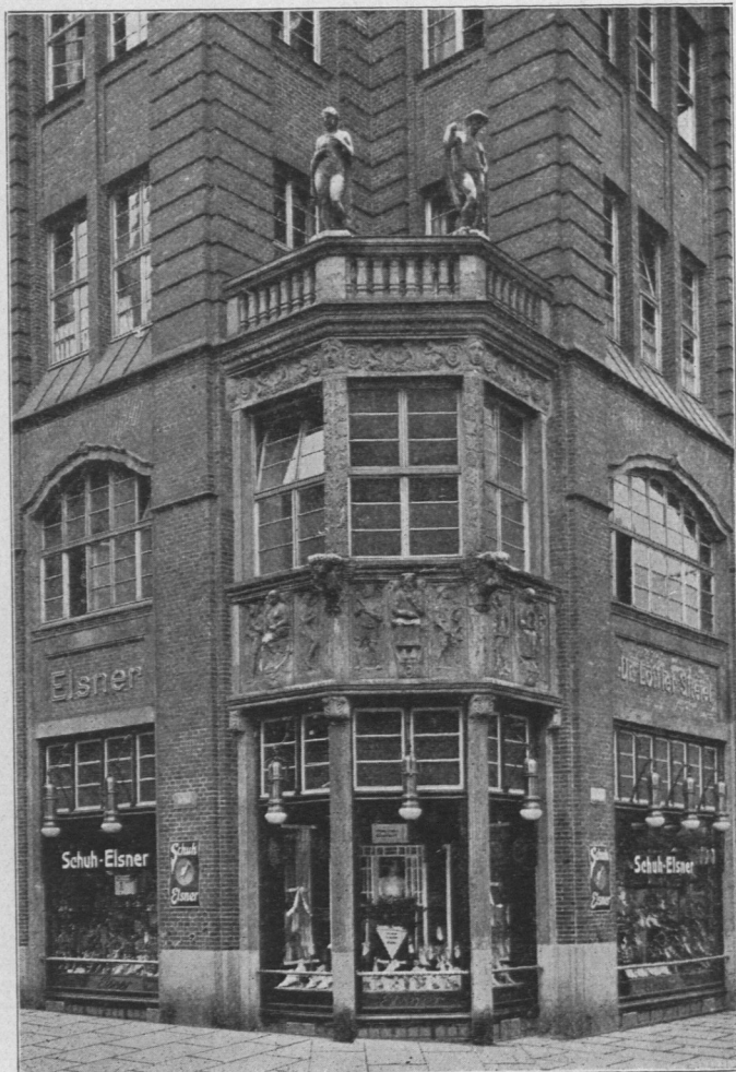
Abb. 897. Rappolt-Haus, Ecke Mönckebergstraße und Barkhof.