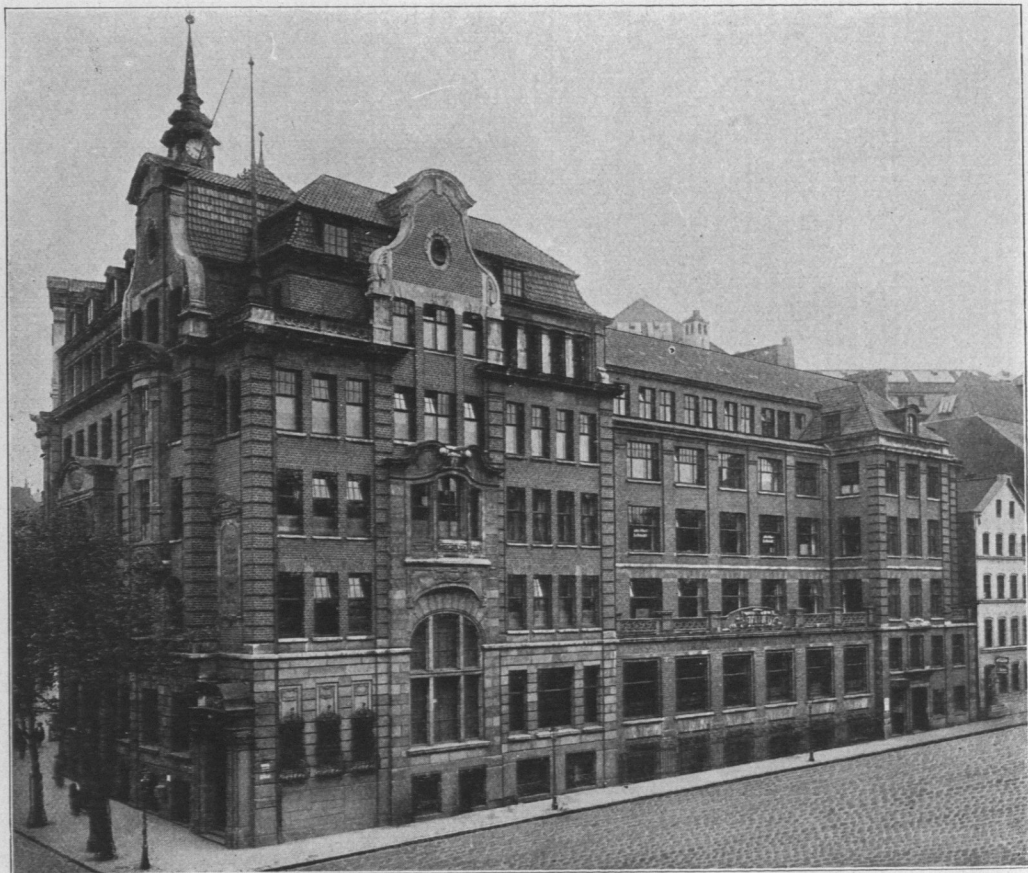
Abb. 889. Janus.