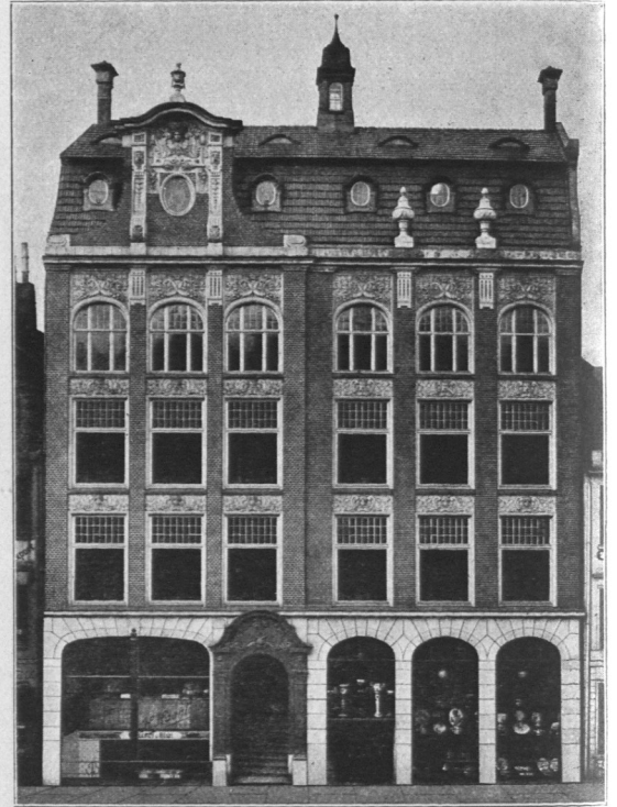
Abb. 874. Haus Haenlein.