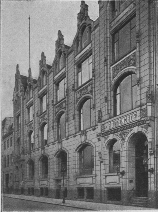
Abb. 872. Boltenhof.