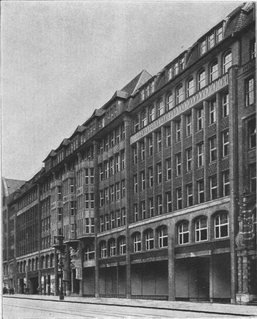
Abb. 864. Levantehaus.

Caledoniahaus, Mönckebergstraße, im Auftrage von F. Rosenstern & Co. erbaut vom Regierungsbaumeister Friedheim, Architekt, B.D.A., 1912/13. Das Erdgeschoß enthält Läden, alle übrigen Geschosse sind für Kontore bestimmt. Außer einem Paternoster-, einem Personen- und einem Waren- aufzug enthält das Gebäude einen Schrägaufzug zur Beförderung der Waren vom Eingang nach dem Keller. Die Straßenseite ist auf Granitsockel in Ziegelrohbau mit Ettringer Tuff hergestellt, das Dach mit grauen Pfannen eingedeckt. Die Baukosten betragen rund 500000 Mark, das sind