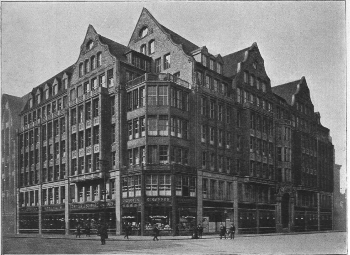
Abb. 862. Südseehaus.