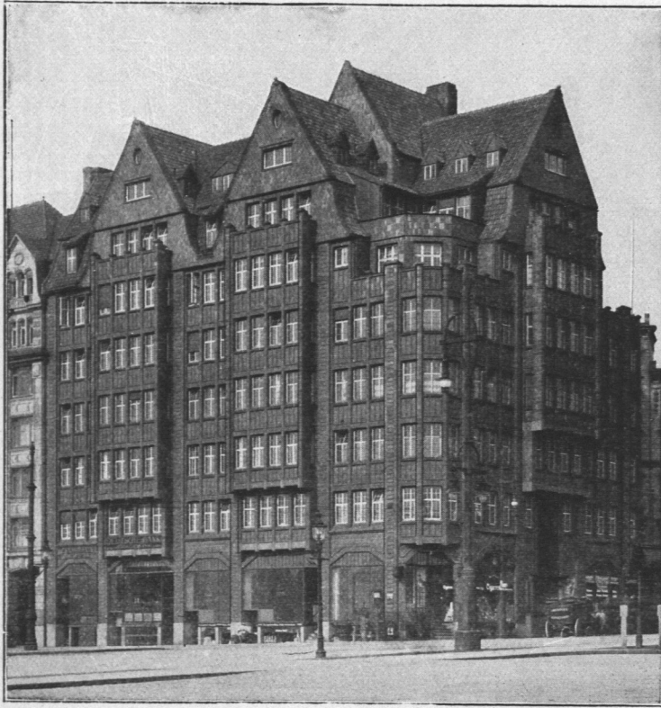
Abb. 860. Klosterthorhof.