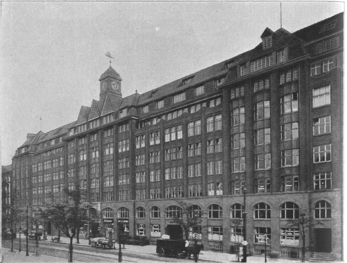
Abb. 858. St. Georgsbau.