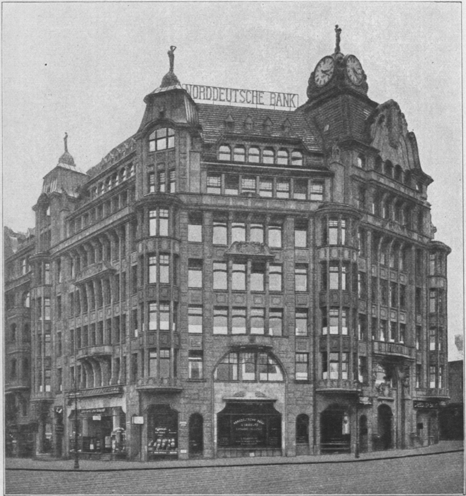
Abb. 847. Fruchthof.