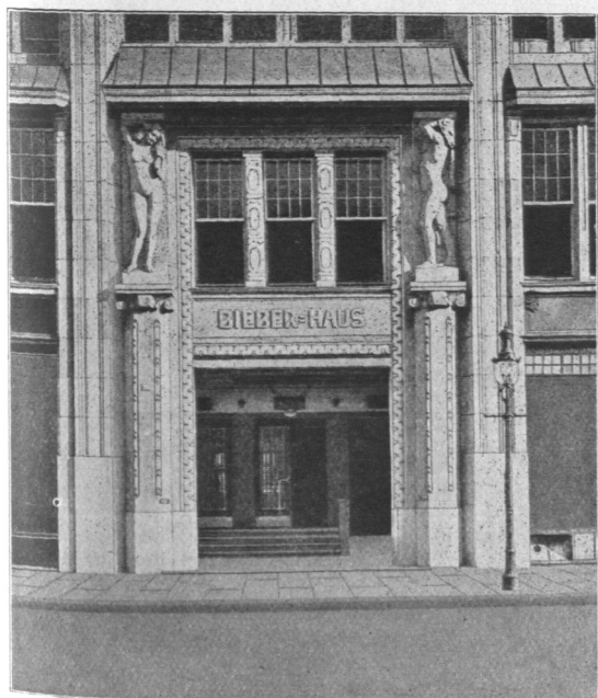
Abb. 845. Bieber-Haus, Einzelheit.