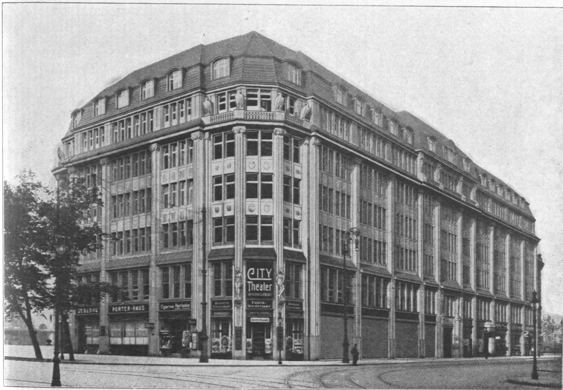
Abb. 844. Bieber-Haus.