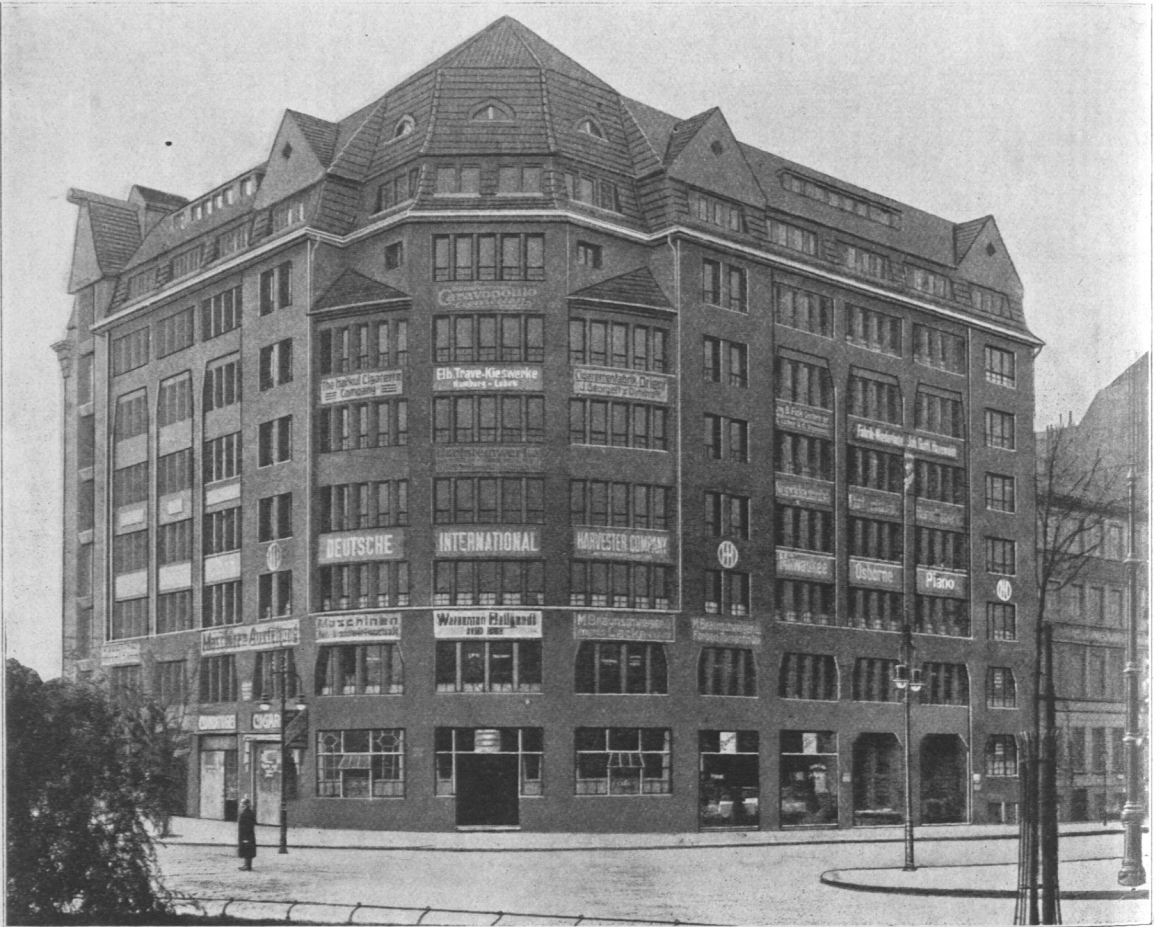
Abb. 841. Weserburg.