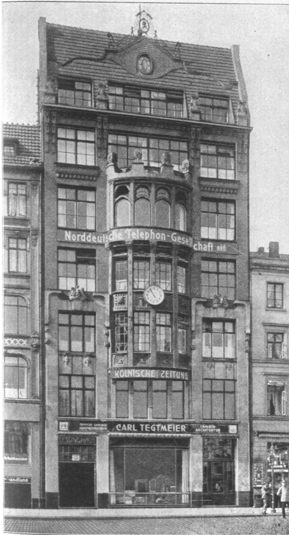
Abb. 837. Lesing-Haus.