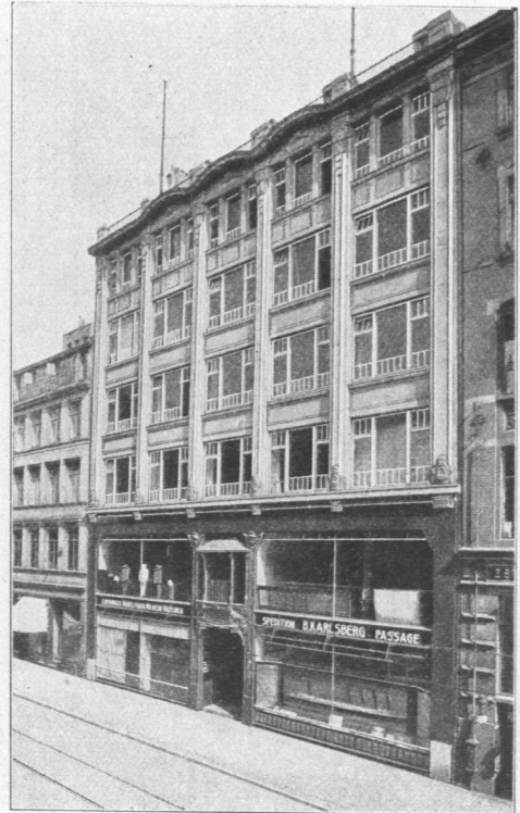
Abb. 839. Schiffahrtshaus.