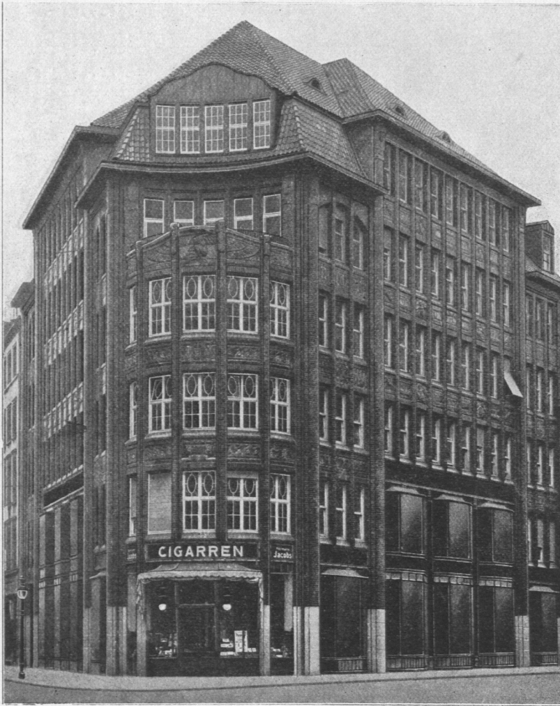
Abb. 821. Gertighaus.